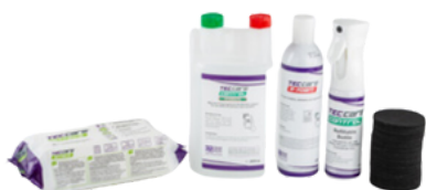
TECcare Drain kit Viemärin desinfiointipakkaus Tuotenro: KIT-DRA-0000