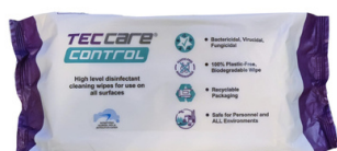
TECcare CONTROL 100kpl Desinfiointiliina Tuotenro: WIP-CON-0096