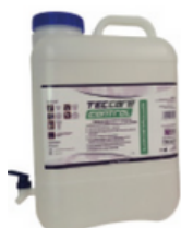
TECcare CONTROL vorTEC 20L Tiiviste sumutinlaitteeseen Tuotenro: FI-V-02-01-20-2